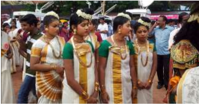
നൃത്തനൃത്യങ്ങളിൽ, തിരുവാതിര, കുമ്മിയടി കലാപ്രകടനത്തിനെത്തിയവർ

എറണാകുളം ജില്ലയിലെ തൃപ്പൂണിത്തുറയിൽ ഓണത്തോടനുബന്ധിച്ച് ചിങ്ങമാസത്തിലെ അത്തം നാളിൽ നടത്തുന്ന ഒരു ആഘോഷമാണ് അത്തച്ചമയം. മലയാളത്തിലെ ചിങ്ങമാസത്തിൽ കൊച്ചി രാജാവു നടത്തുന്ന വിജയാഘോഷയാത്രയാണ് തൃപ്പൂണിത്തുറ അത്തച്ചമയ ഘോഷയാത്രയായി ആഘോഷിക്കുന്നത്. അദ്യകാലത്ത് രാജാവും പരിവാരങ്ങളും ഈ ഘോഷയാത്രയിൽ പങ്കെടുത്തിരുന്നു. എന്നാൽ ഇന്ന് രാജാവ് പങ്കെടുക്കുന്നില്ല എങ്കിലും അത്തച്ചമയത്തിന്റെ പ്രൗഢിക്ക് ഒരു മങ്ങലും വരുത്താതെയാണ് ഘോഷയാത്ര നടത്തുന്നത്. അത്തം നാളിൽ കൊച്ചിരാജാവ് സർവാഭരണ വിഭൂഷിതനായി സർവസൈന്യ സമേതനായും കലാസമൃദ്ധിയോടും കൂടി ഘോഷയാത്രയായി പ്രജകളെ കാണാനെത്തുന്ന സംഭവമാണ് രാജഭരണകാലത്തെ അത്തച്ചമയം. 1949 ൽ തിരുവിതാംകൂർ - കൊച്ചി സംയോജനത്തോടെ രാജകീയ അത്തച്ചമയം നിർത്തലാക്കി. 10 ദിവസം നീണ്ടു നിൽക്കുന്ന ഓണഘോഷങ്ങൾക്ക് തുടക്കം കുറിക്കുന്ന ദിവസമാണ് അത്തം. സമാധാനവും, ഐശ്വര്യവും നിറഞ്ഞ തന്റെ ഭരണകാലം ഓർമ്മിക്കുവാനും തന്റെ പ്രജകളെ നേരിൽ കാണുവാനും മഹാബലി ചക്രവർത്തി കേരളത്തിൽ വരുന്ന ദിവസമാണ് ഓണമെന്നു പറയുന്നതോടൊപ്പം ഇതു വിളവെടുപ്പുകാലം കൂടിയാണ്.