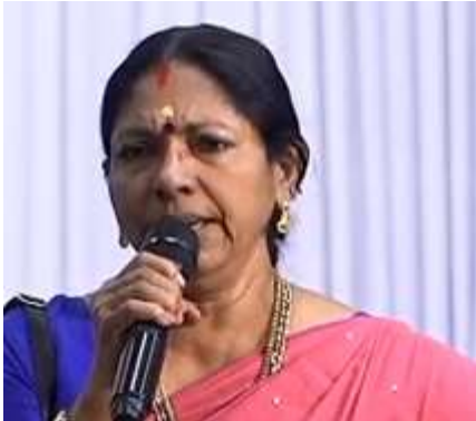
നാമാ നീ വരും കാലൊച്ച കേൾക്കുവാൻ.....