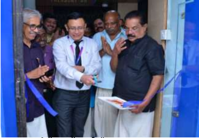
നാട മുറിച്ച് സബ് ഓഫീസ് തുറന്നു കൊടുക്കുന്നു.