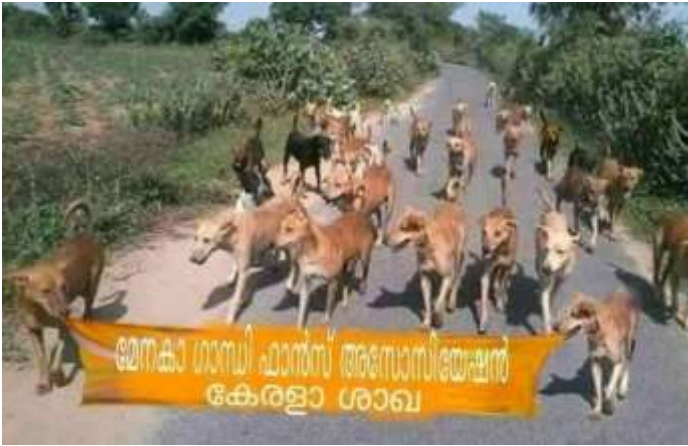
ATM ൽ ഒക്കെ സുരക്ഷ കൂട്ടിയിട്ട് ഉണ്ടെന്ന് പറഞ്ഞപ്പോൾ ഇത്രയും പ്രതീക്ഷിച്ചില്ല 😂🙏