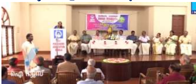
തിരുവോണപ്പുലരിതൻ തിരുമുൽക്കാഴ്ച്ച കാണാൻ തിരുമുറ്റമണിഞ്ഞൊരുങ്ങി...