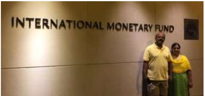
ഇന്റർനാഷണൽ മോണറ്ററി ഫണ്ടിന്റെ കവാടത്തിൽ

അമേരിക്ക എന്റെ ഒരു സ്വപ്ന ഭൂമി ആയിരുന്നു .. രണ്ടു മക്കളും ഐ.റ്റി. ഫീൽഡിൽ ആയപ്പോൾ അവർക്കു ആർക്കെങ്കിലും യു.എസ്. അഡ്വൈസ്‌മെന്റ് കിട്ടിയിട്ടുണ്ടെന്ന് ഞാൻ വളരെ പ്രാർത്ഥിച്ചിരുന്നു . 2015 മാർച്ച് മാസം എന്റെ മകൻ ടാറ്റ കൺസൾട്ടന്റിനു സെർവീസിൽ നിന്ന് , അമേരിക്കയിലെ വാഷിംഗ്ടൺ ഡി.സി.യിൽ ഇന്റർനാഷണൽ മോണറ്ററി ഫണ്ടിൽ (IMF) പോസ്റ്റിങ്ങ് ലഭിച്ചു