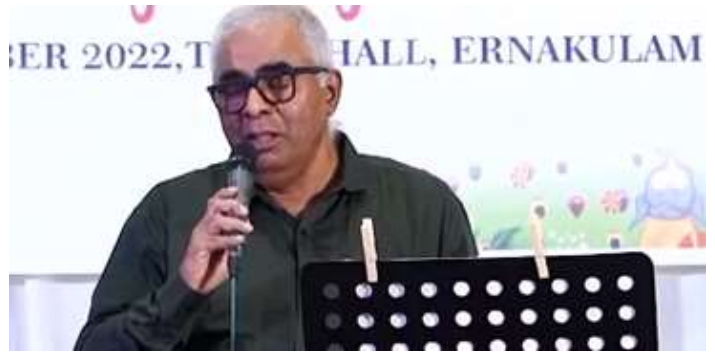
ആസ്മാൻ സെ ആയി പരിസ്കാർ..... കണ്ണനുണ്ണി