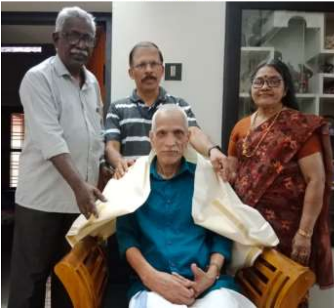
പൊന്നാട അണിയിച്ച് ആദരിക്കുന്ന സഹപ്രവർത്തകരും