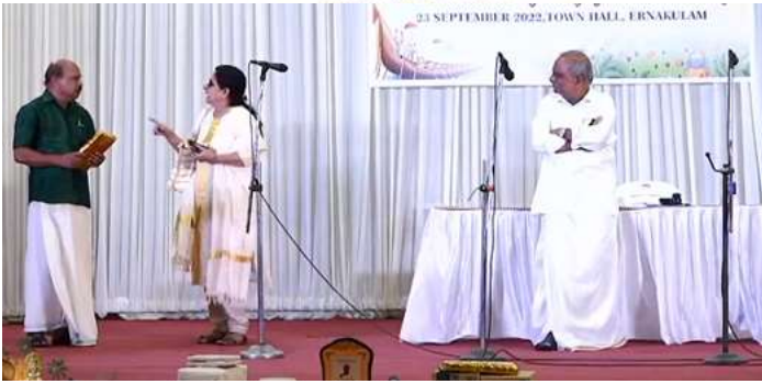
ലഘു നാടകം “...നാങ്ങളു ഓണമുണ്ണാൻ വാ”