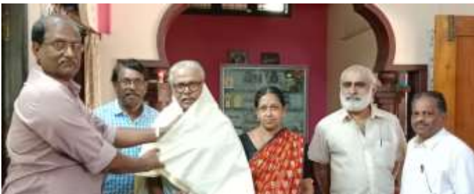
പൊന്നാട അണിയിച്ച് ആദരിക്കുന്ന ജില്ലാ പ്രസിഡന്റ് വേലായുധനും സഹപ്രവർത്തകരും