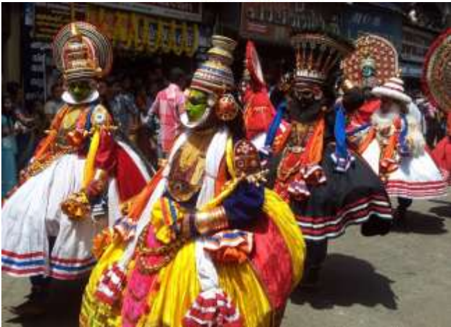
കഥകളി വേഷങ്ങൾ അത്തചമയത്തിൽ