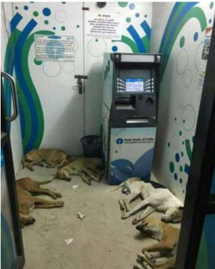
ഇത്രയും വലിയ സുരക്ഷ ഏർപ്പെടുത്താൻ സ്റ്റേറ്റ് ബാങ്കിന് മാതൃമേ കഴിയും.