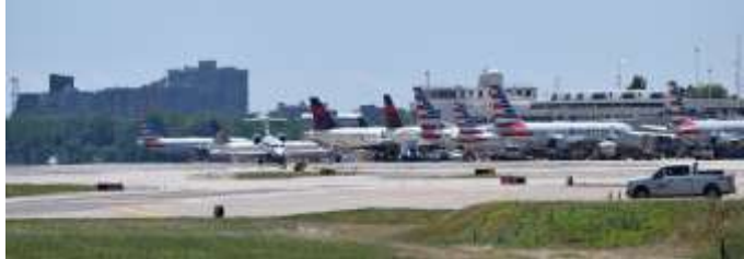
റൊണാൾഡ് റീഗൻ വാഷിംഗ്ടൺ നാഷണൽ എയർപോർട്ട്

ഗ്രാവേലി പോയിന്റ് പോട്ടോമാക് നദിയുടെ പടിഞ്ഞാറേ വശത്തു സ്ഥിതി ചെയ്യുന്ന ഒരു വിശാലമായ പാർക്ക് ആണ്.