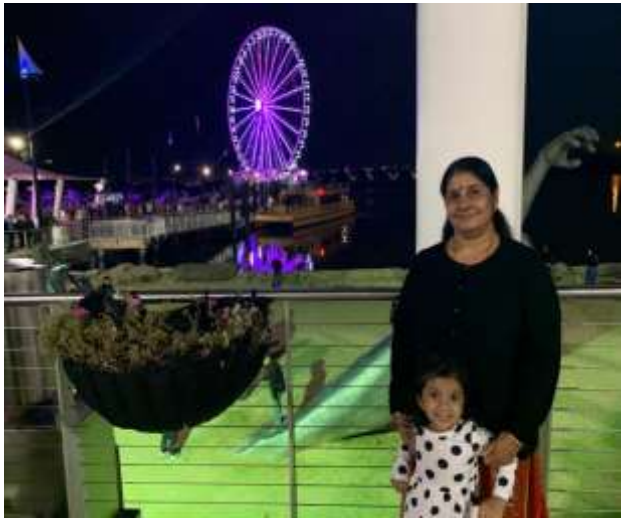
നാഷണൽ ഹാർബോറിലെ ജയന്റ് വീൽ

വാഷിംഗ്ടൺ ഡിസി കരീകെ പോട്ടോമാക് നദിയുടെ തീരത്തു 350 ഏക്കറിൽ ഒരുക്കിയിരിക്കുന്ന ഒരു വാട്ടർഫ്രണ്ട് റിസോർട്ട് ഏരിയ ആണ് നാഷണൽ