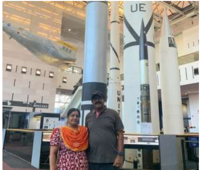
നാഷണൽ എയർ ആൻഡ് സ്പേസ് മ്യൂസിയം