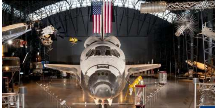
Steven F. Udvar-Hazy Center

ഏറ്റവും വലിയ മ്യൂസിയങ്ങളുടെ ഒരു അതിശയിപ്പിക്കുന്ന സഞ്ചയം. അതിലൊന്നാണ് ഞങ്ങൾ സന്ദർശിച്ച നാഷണൽ എയർ ആൻഡ് സ്പേസ് മ്യൂസിയം.