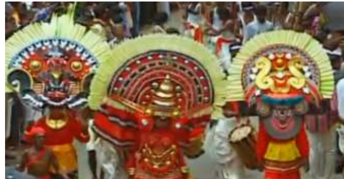
പടയണി തുടങ്ങിയ കലാരൂപങ്ങൾ