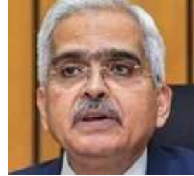
റിസർവ് ബാങ്ക് ഗവർണർ ശക്തികാന്തദാസ്

ഇടപാടുകൾ കൂടുതൽ സുരക്ഷിതമാക്കാനും സൈബറാക്രമണത്തിൽ നിന്ന് ഉപഭോക്താക്കൾക്ക് സംരക്ഷണമൊരുക്കാനും റിസർവ് ബാങ്ക് നടപ്പാക്കുന്ന കാർഡ് ടോക്കൺസേഷൻ ഒക്ടോബർ ഒന്നിന് നിലവിൽ വരും. സാങ്കേതിക സൗകര്യമൊരുക്കുന്നതിന് ഇനിയും സമയം നീട്ടി നൽകില്ലെന്ന് ആർ.ബി.ഐ. വ്യക്തമാക്കിയിട്ടുണ്ട്.