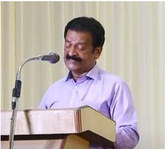
എക് ദിൻ ബിക് ജായേഗാ.... പി.പി.രാജു