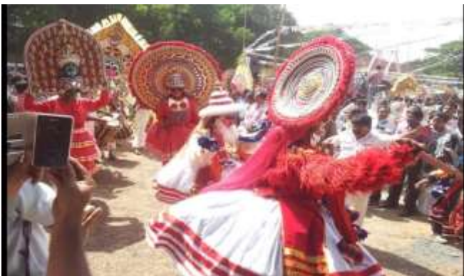
തെയ്യവും തിരയും നിറഞ്ഞാടുന്ന അത്തചമയ വിശേഷം