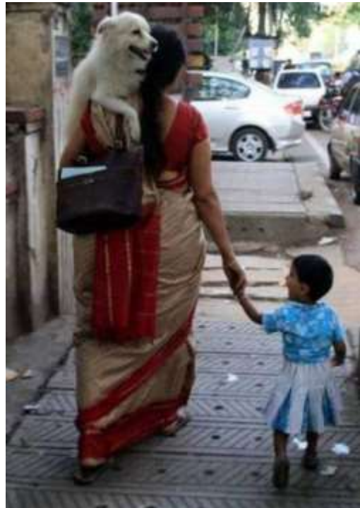
തോളത്തു വക്കേണ്ടത് താഴത്തും. താഴെ നിർത്തേണ്ടത് തോളത്തും ഇപ്പോഴത്തെ കേരളത്തിന്റെ നേർക്കാഴ്ച