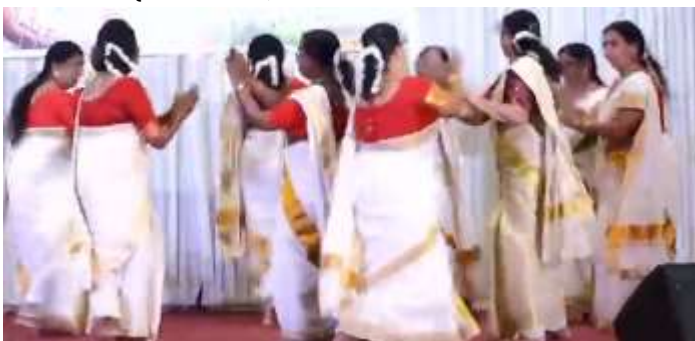
പിച്ചിപ്പൂ കൊണ്ടെത്തരാമെ.....തിത്താരാ തിമുതൈ.... നാടോടി നൃത്തം