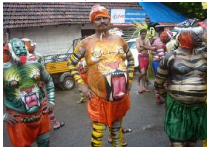
തൃശ്ശൂരിന്റെ തനതു കലയായ പുലികളി