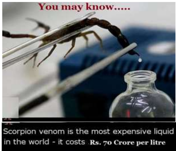
പ്രകൃതിയിൽ, മൃഗങ്ങൾ സ്വയം പ്രതിരോധത്തിനോ ഇര പിടിക്കാനോ വിഷം ഉപയോഗിക്കുന്നു. ലാബിൽ, വിഷ